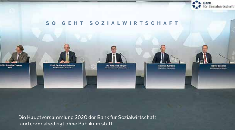
Die Hauptversammlung 2020 der Bank für Sozialwirtschaft fand coronabedingt ohne Publikum statt.